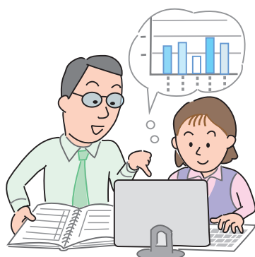
図1 繰越税額控除制度のイメージ

この規定の適用を受ける場合には、賃上げ促進税制の適用を受けた事業年度以後の各事業年度の確定申告書等に、明細書を添付する必要があります。